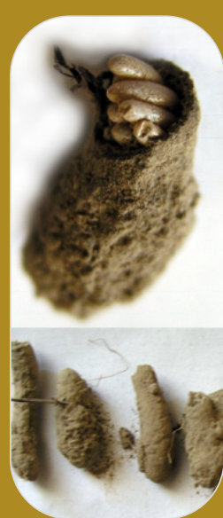
Uova e ooteche